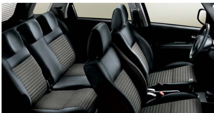
150 Tkanina piaskowa