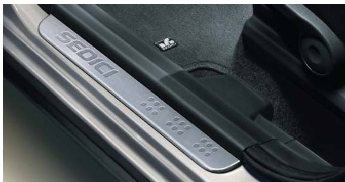
Nakładki progowe (nr 71803250)