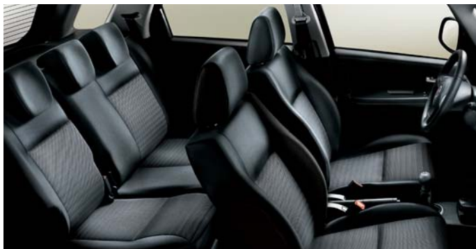
121 Tkanina szara