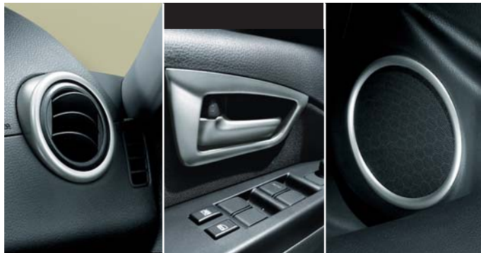
Aluminiowe elementy wykończenia wnętrza: na klamki (nr 71803372), na wloty powietrza i głośniki (nr 71803308)