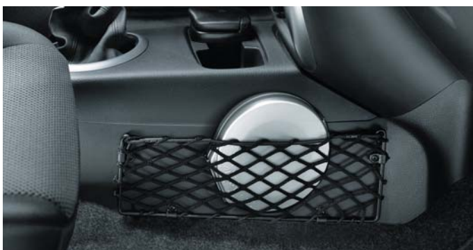
Siatka tunelu (nr 71803304)