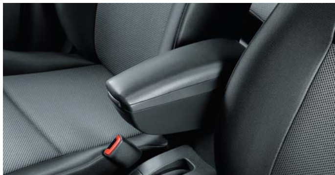
Podłokietnik przedni (nr 71803342)