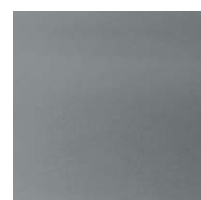
976 Szary West Coast