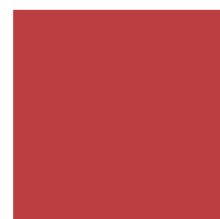
985 Czerwony Bambuco