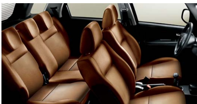
495 Skóra brązowa