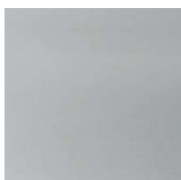
977 Szary Techstep