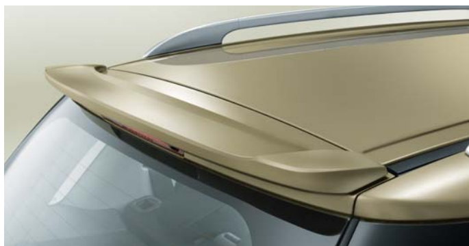
Spojler tylny (nr 71803344)