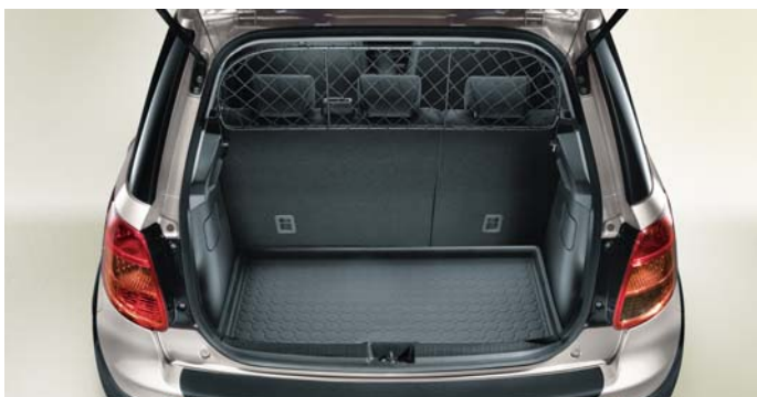
Siatka oddzielająca, do przewozu zwierząt (nr 71803249) Półsztywna wykładzina bagażnika (nr 71803306)